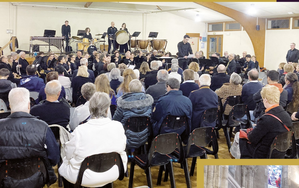
Concert de l'orchestre d'harmonie de Marmande le 4 octobre 2024 sur le thème des Olympiades