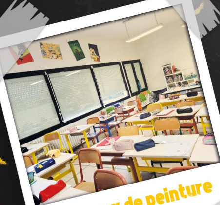
Travaux de peinture

Pour couronner cet évènement, le peloton de la ronde a emprunté les routes des étapes Lot-et-Garonnaises du Tour de France à Agen et Villeneuve, villes étapes du tour 2024.