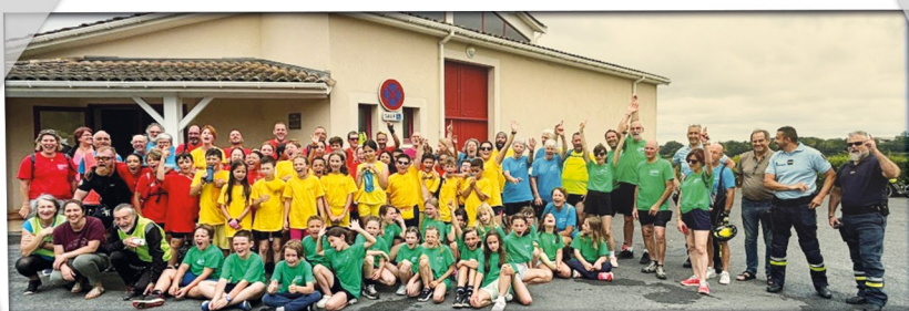
la 30 ème Ronde cyclo USEP

Dans son plan pluriannuel d'amélioration des locaux scolaires, le couloir et les deux classes ce2 et cm1 ont été entièrement repeints pour rendre ces classes plus accueillantes et agréables à vivre.