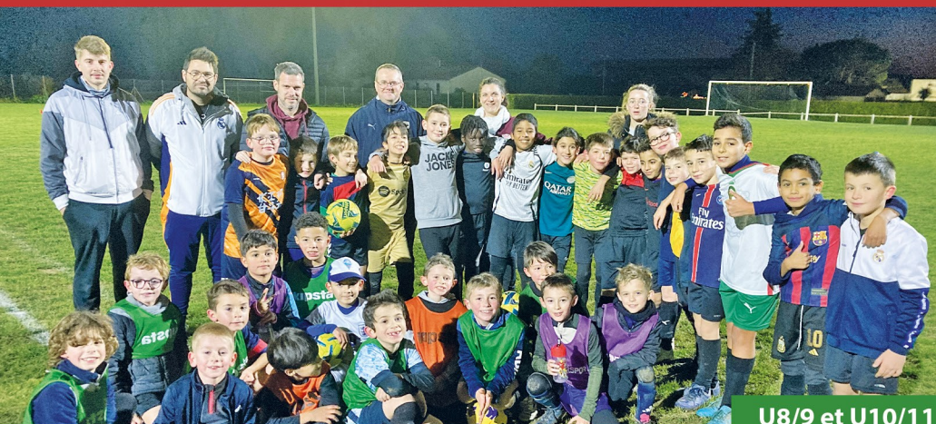
U8/9 et U10/11